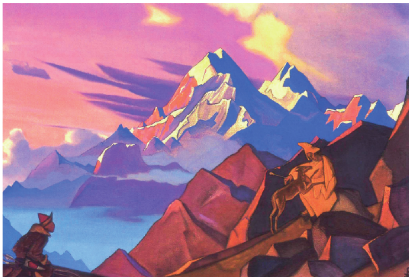
Рис. 2. Н.К. Рерих. Сострадание. 1936 Pic. 2. N.K. Roerich. Compassion. 1936