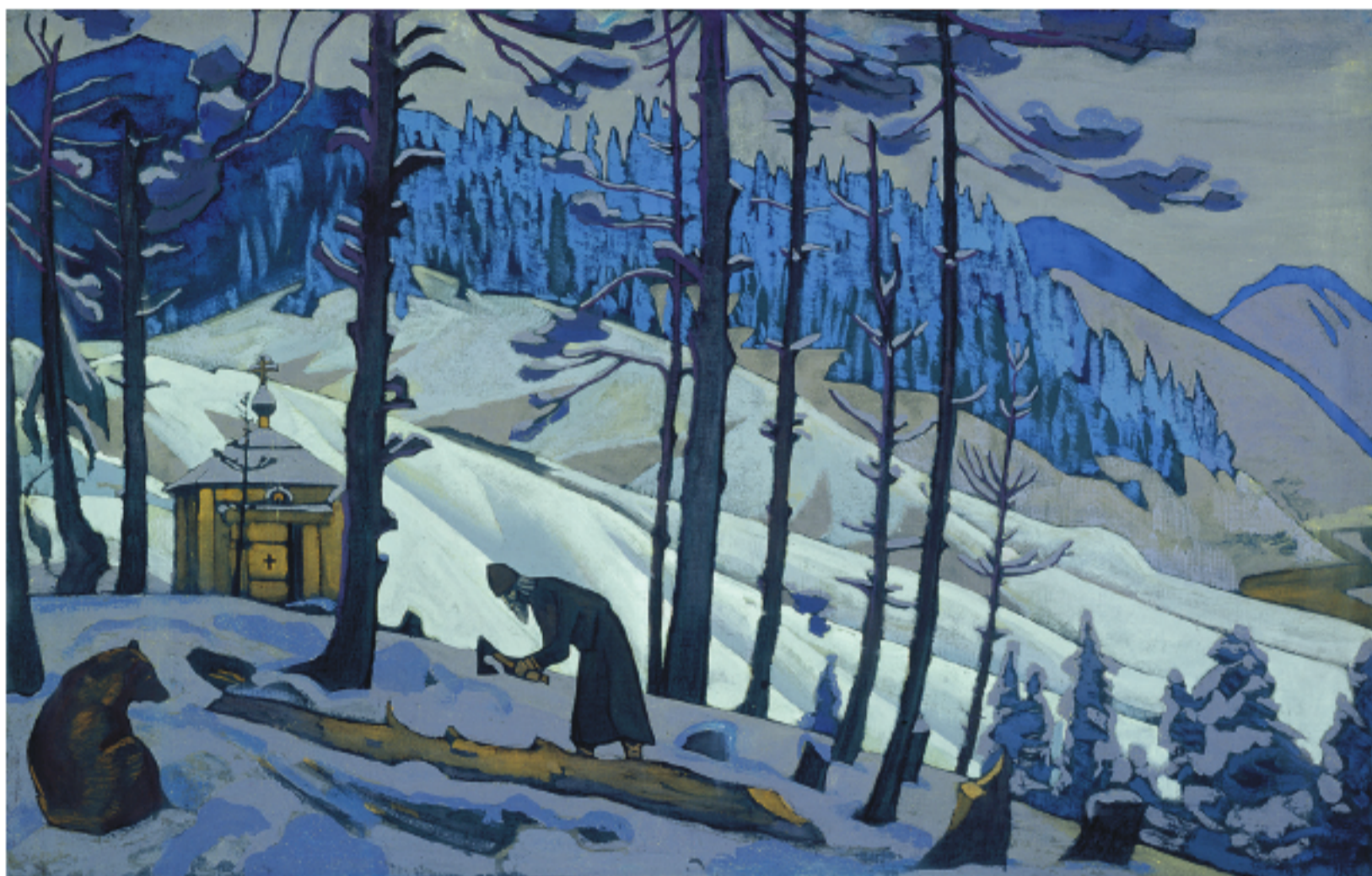
Рис. 1. Н.К. Рерих. Сергей Строитель. 1924

Roerich N. Legends of Asia. [Legendy Azii] Moscow, Eksmo, 2014