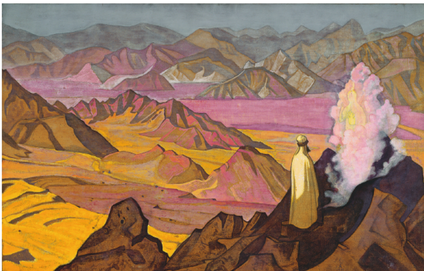
Рис. 9. Н.К. Рерих. Магомет на горе Хира. 1925 Pic. 9. N.K. Roerich. Mohammed on mount Hira. 1925