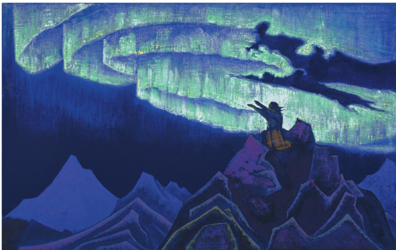
Рис. 8. Н.К. Рерих. Моисей Водитель. 1925 Pic. 8. N.K. Roerich. Moses The Leader. 1925