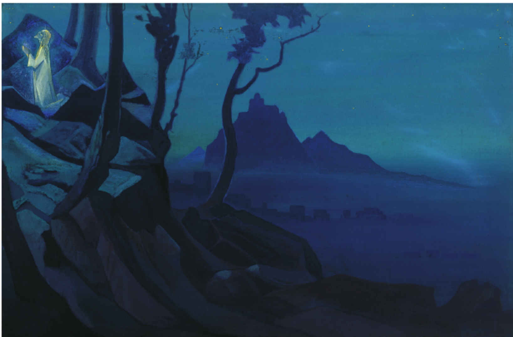
Рис. 5. Н.К. Рерих. Моление о Чаше. 1925 Pic. 5. N.K. Roerich. Agony in the garden. 1925