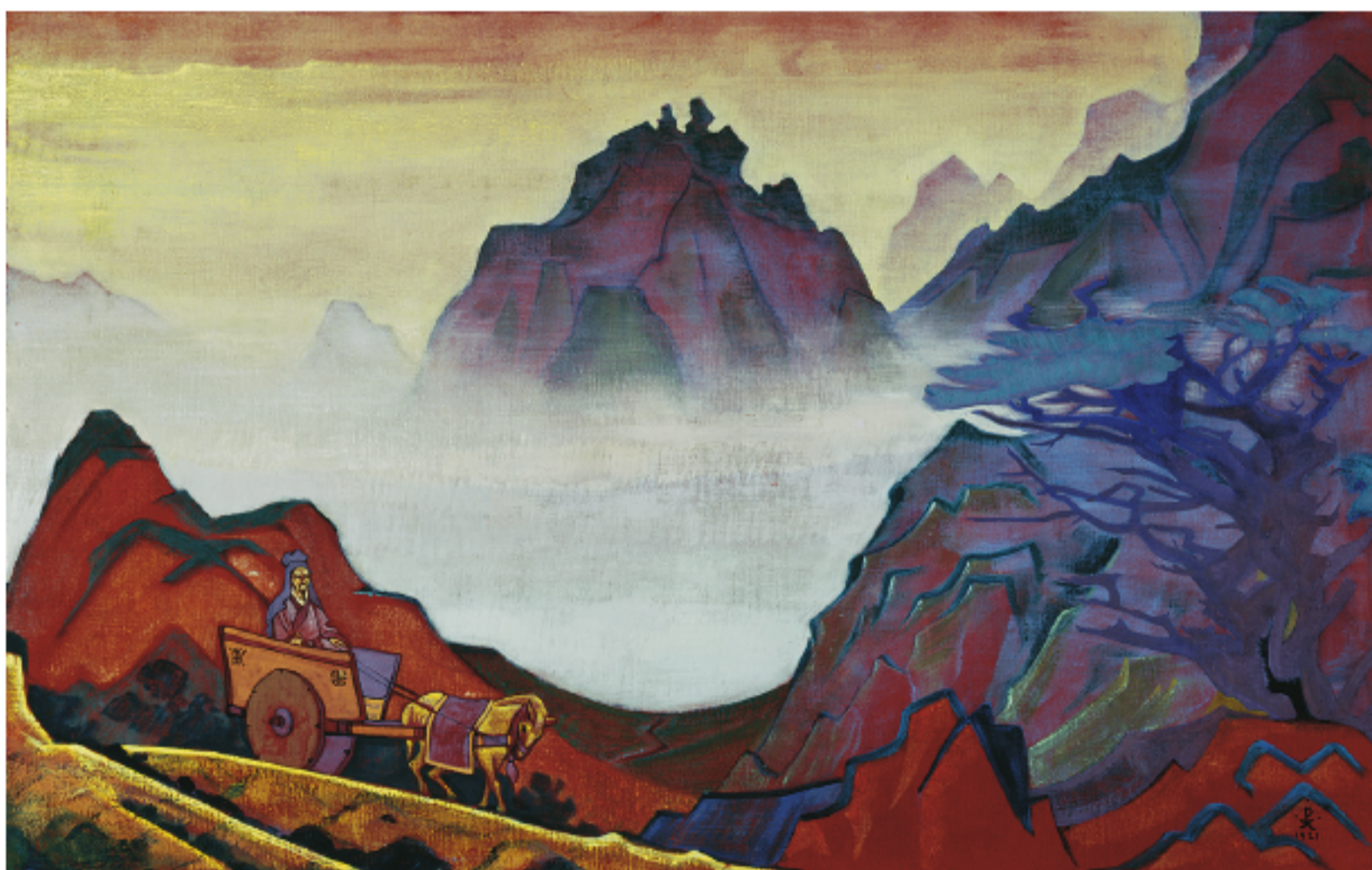
Рис. 7. Н.К. Рерих. Конфуций Справедливый. 1924 Pic. 7. N.K. Roerich. Confucius Fair. 1924