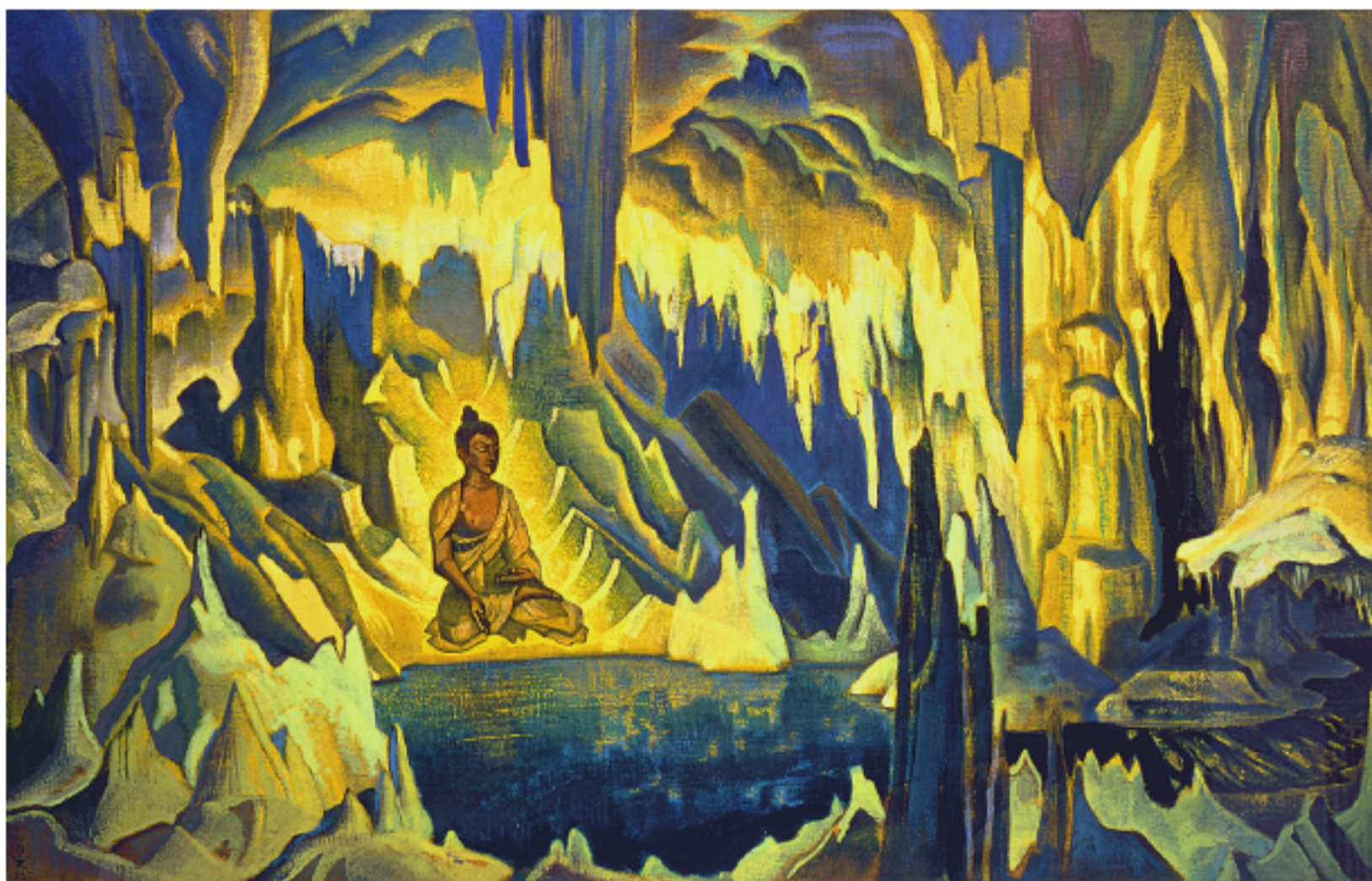
Рис. 6. Н.К. Рерих. Будда Победитель. 1925 Pic. 6. N.K. Roerich. Buddha The Conqueror. 1925